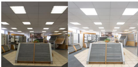
Showroom vor und nach der Umrüstung mit der Deutschen Lichtmiete

Bei Veröffentlichung freuen wir uns über Ihr kurzes Signal oder einen Beleg – vielen Dank!